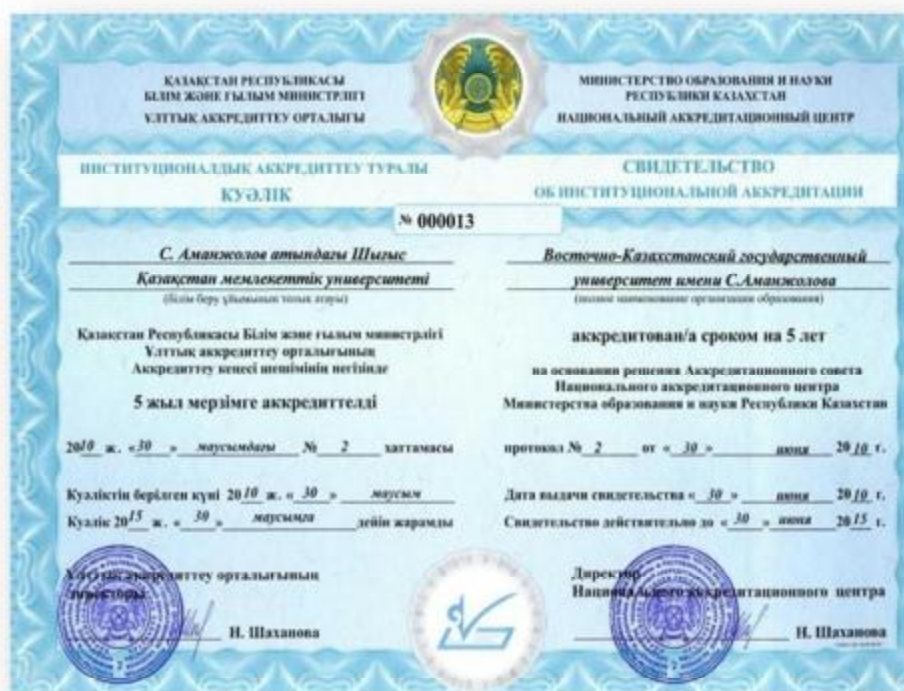
Bevis över institutionell ackreditering tillhörande Östkazakiska statliga universitet. Dokumentet är utfärdat av Nationella ackrediteringscentret.

Den programbaserade ackrediteringen påbörjades 2007 och sköts istället av icke-statliga utländska ackrediteringsorganisationer. Exempelvis har Kazakiska nationella tekniska universitetet, förutom sin institutionella ackreditering, även elva ackrediterade tekniska och naturvetenskapliga program, vilka har ackrediterats av de utländska ackrediteringsorganisationerna ABET (USA), ASIIN (Tyskland) och AIOR (Ryssland).