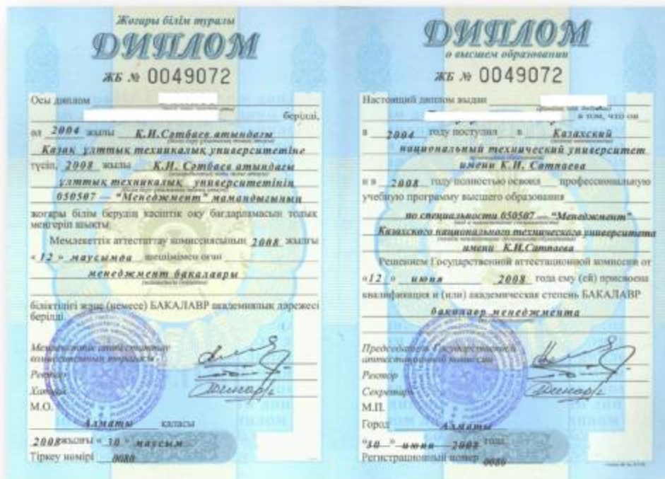
Exempel på en kazakisk bachelorexamen (bakalavr).

Utöver dessa Bolognaexamina finns det alltså kvar ett antal examina under utfasning. Dessa är specialistdiplomet och kandidat nauk respektive doktor nauk. Specialistdiplomet är ursprungligen en sovjetisk (vanligtvis) 5-årig utbildning som delas in i hundratals yrkesförberedande specialinriktningar. Då specialistdiplomet inte passar in i Bolognamodellen beslutades det år 2006 att denna examensform skulle avskaffas. Under 2010 kommer de sista specialistdiplomen att utfärdas. Kandidat nauk och doktor nauk är forskarutbildningar, vilka består av först en 2- eller 3-årig aspirantura-utbildning som leder fram till en kandidat nauk följt av en 3-årig eller längre doktorantura som avslutas med doktor nauk. För närvarande existerar kandidat nauk och doktor nauk parallellt med den nya PhD-utbildningen (se ovan). Men på sikt kan man anta att doktorsdiplomet (som bättre passar in i Bolognamodellen) kommer att ersätta kandidat nauk och doktor nauk.